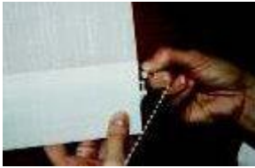
Natikanje povezovalne vrvice

V razširjeni del uteži zatakните povezovalno verižico. Glede na tip uteži se le ta natika od zgoraj ali s strani. Vedno začnite iz zadnje strani zavese od enega do drugega konca in preden prerežete verižico se prepričajte ali so povezane vse uteži v pravilnem vrstnem redu. Potem jih povežite še s sprednje strani. Ko ste povezali vse, verižico odrežite na vseh štirih koncih cca. 2 cm od konca.