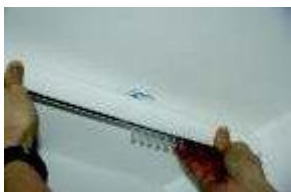
Karnisa - zadnji rob v nosilcu

Preden pritrdite karniso na nosilce, jo obrnite tako, da bo komanda z vrvico in verižico na želeni strani. Karniso vtisnite v nosilec tako, da vstavite zadnji rob karnise v nosilec in nato pritisnete še na prvi rob, da se ta zaskoči. Nosilec, ki drži karniso je enak pri stropni in stenski montaži, le da je pri stenski montaži vpet v dodatno konzolo.