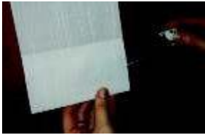
Pravilno obračanje uteži

Ko so vsi trakovi obešeni, zaveso s pomočjo vlečne vrvice raztegnite. V spodnji rob trakov, v varjene žepe, vtaknite uteži. Te so lahko kovinske ali plastične, pozorni moramo biti na to, da so vse nameščene tako, da je razširjeni del uteži, kamor pritrdite povezovalno vrvico, na zgornji strani.