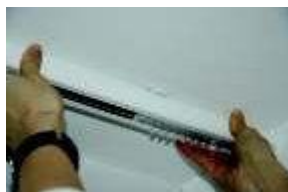
Karnisa - sprednji rob v nosilcu