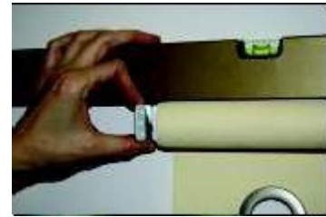
(umerjanje roloja z vodno tehtnico)