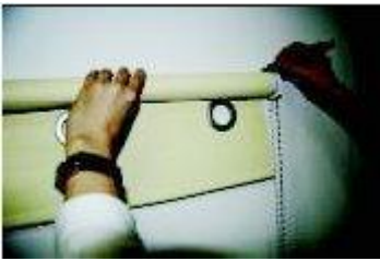
(določanje položaja nosilcev)

Roloje lahko montirate na strop prostora, na strop okenske odprtine, bočno na steno nad okensko odprtino ali bočno na okno (primerno, če se okna ne odpirajo). Nosilci so pritrjeni na obeh koncih roloja. S pomočjo roloja določite točke pritrditve nosilcev in najprej pritrдите en nosilec (nosilec se pritrji z dvema vijakoma, le pri manjših rolojih zadostuje en vijak), drugega pa s pomočjo vodne tehtnice pritrдите popolnoma vodoravno.