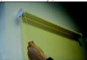
(preskušanje delovanja roloja)